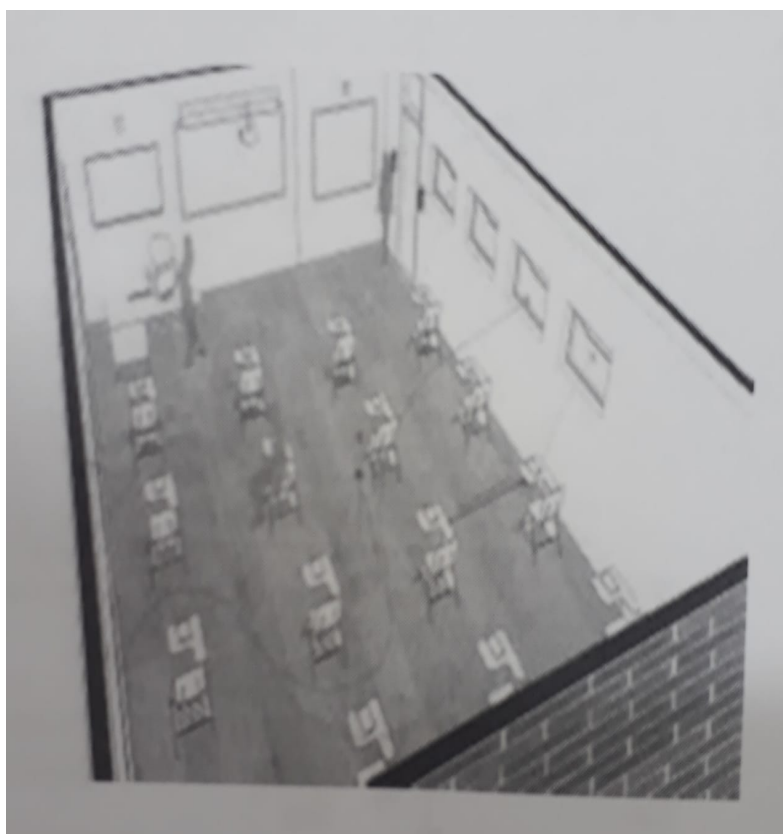
Modelo de distribuição dos alunos na sala de aula.