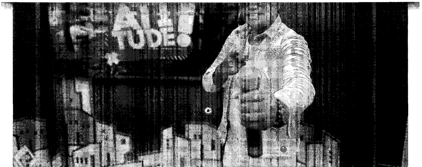
Jefferson Borges / Bahia FM