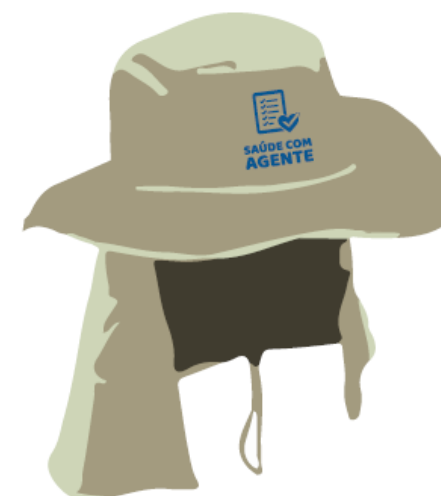
parte da frente do chapéu