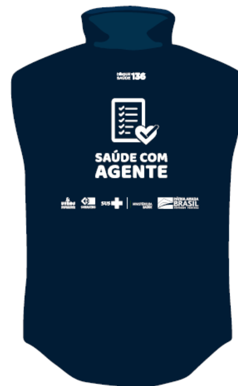
parte de trás