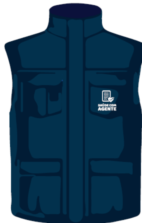
parte da frente